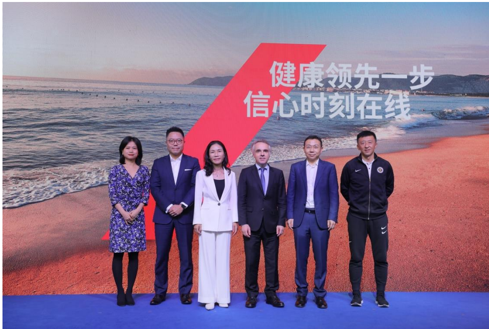
到场嘉宾共同解锁安盛健康公式

安盛健康公式 由健康的心理、无微不至的家庭医生、一站式抗风险解决方案以及深刻的洞察所构成，生动展示了安盛作为客户健康旅程的陪伴者，在健康管理领域的全方位布局，以及在为客户提供定制化解决方案方面，所具备的强大品牌优势。